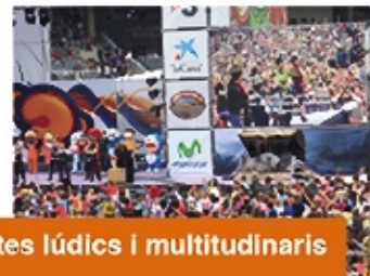
Actes lúdics i multitudinaris

Una entitat sense ànim de lucre que treballa per promoure i defensar la igualtat d'oportunitats per a totes les persones sordes i la seva plena integració social .