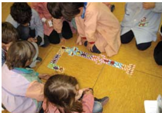
Un taller del "Joc de les postres", inclòs en el projecte Menja Bo

L'àrea d'Ensenyament del Consell es fa càrrec d'implementar, organitzar i coordinar els serveis complementaris d'educació: transport i menjador escolars, ajuts individuals de menjador i transport. El servei de transport escolar d'aquest curs dona servei a 1.946 alumnes (25 línies d'autobús amb 42 vehicles per donar servei a 1.783 alumnes i 26 taxis o vehicles adaptats que transporten 163 alumnes amb discapacitat o residents en nuclis disseminats). També elabora diversos projectes educatius, com la campanya "Menja bo" -per a l'educació gastronòmica