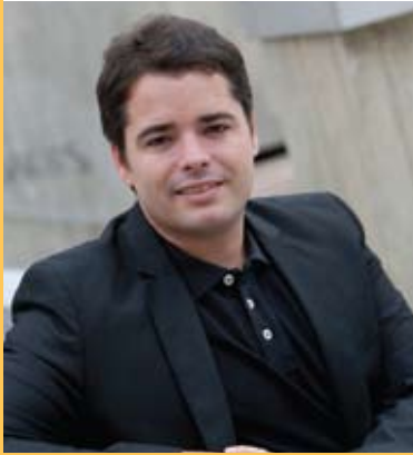
CONSELLER DESENVOLUPAMENT COMARCAL